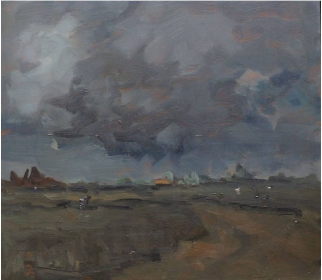
Olieverfschetsje in grijsig coloriet. L.o. signering met JC door elkaar.