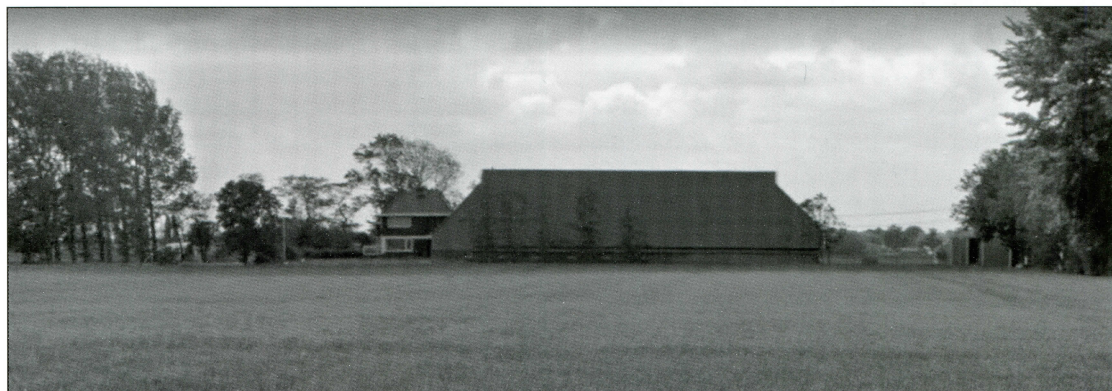
Boerderij familie Bierens.

De boerderij van de familie Omta had een lange oprit. Vader Omta had eerder al bij de weg een hek op de dam laten plaatsen. Bij onraad gaf het gesloten hek de onderduikers wat meer tijd om zich te verstoppen.